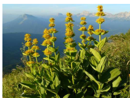
La Chartreuse d'Aillon