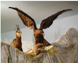
La Chartreuse d'Aillon